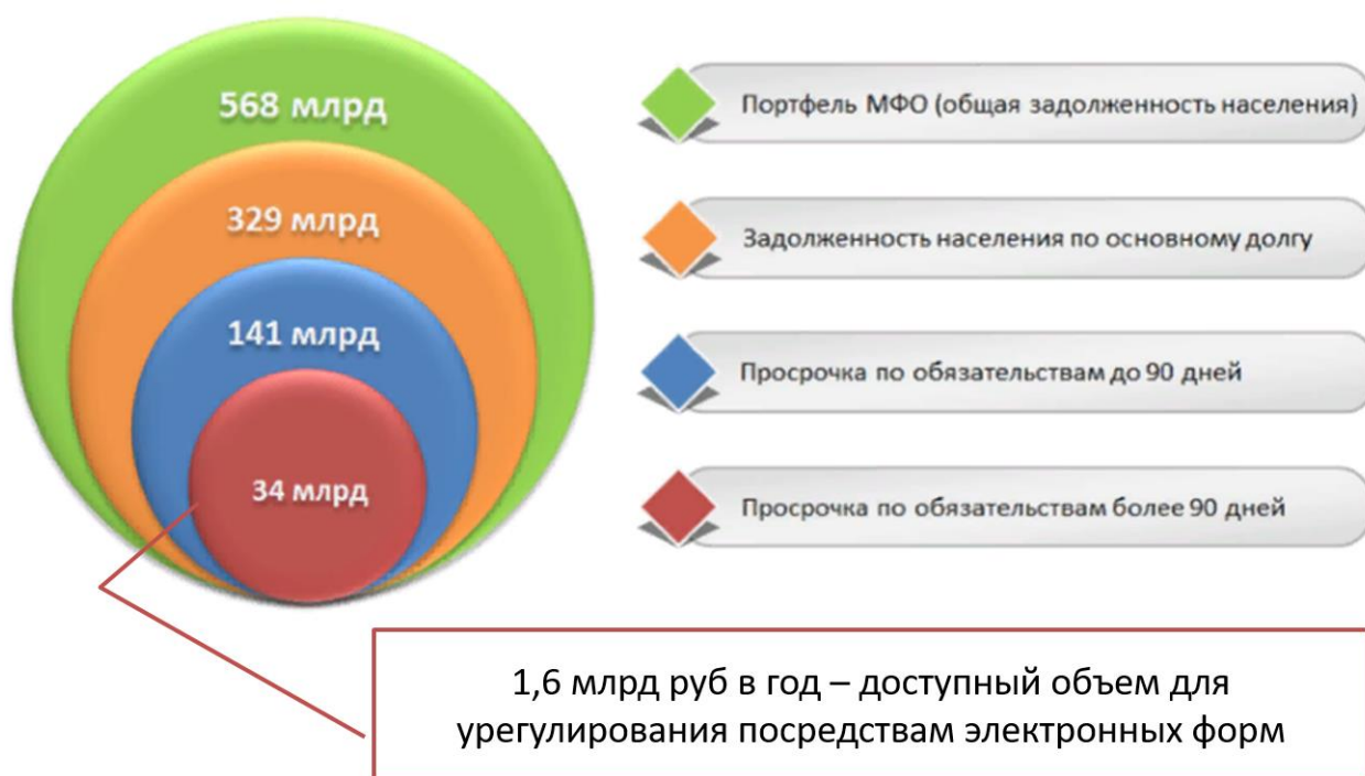
Рис. 1. Цели реализации программы «Жизнь без долгов»

Беря во внимание средний размер задолженности, можно говорить об объеме разрешенных проблем на сумму не менее 1,6 млрд рублей ежегодно (Рис.1).