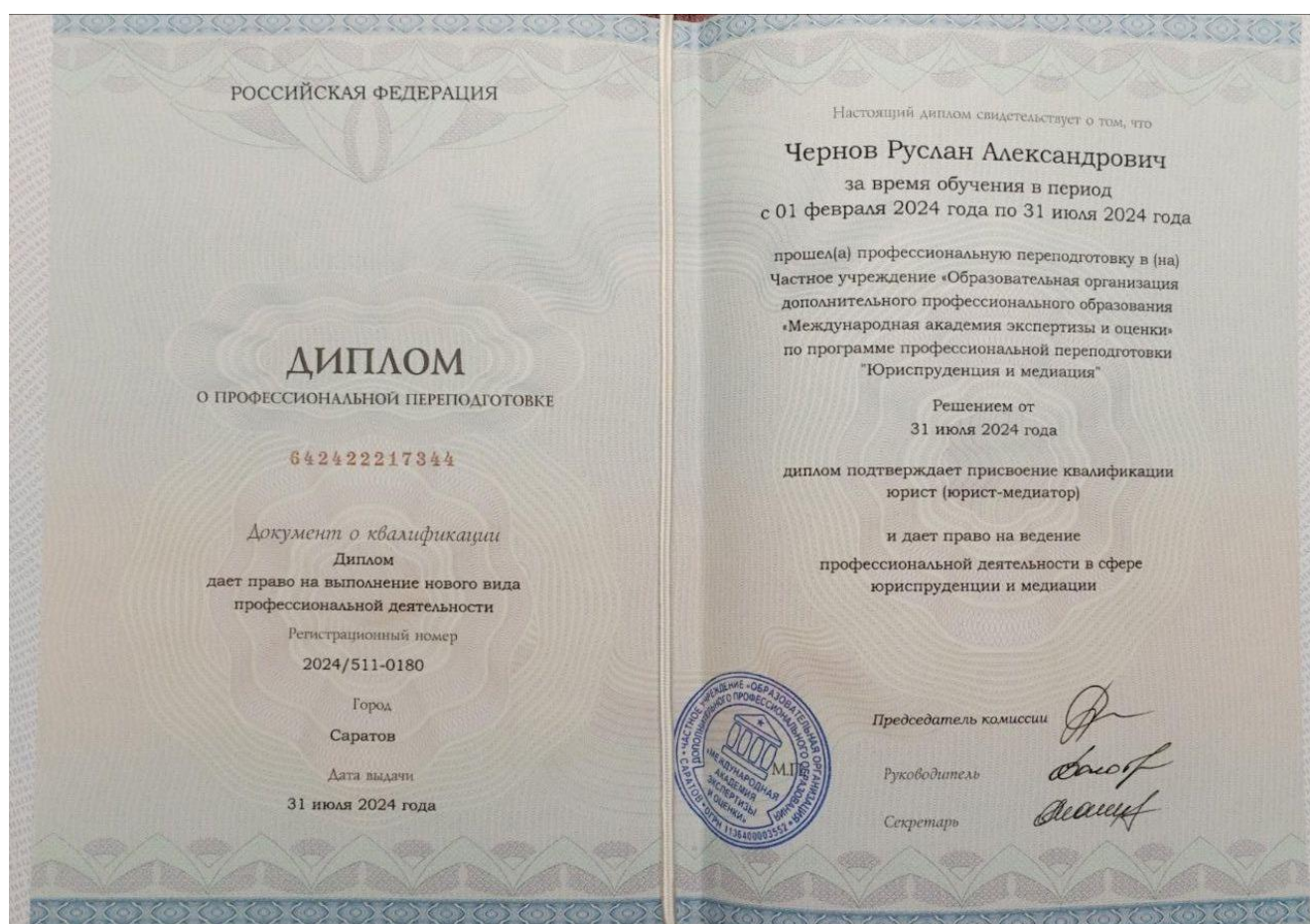
Рис.3 Диплом Юриста-медиатора